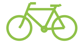
Solution de transport