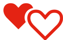
Vie affective et sexuelle