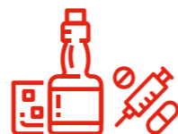
Alcool / Drogue