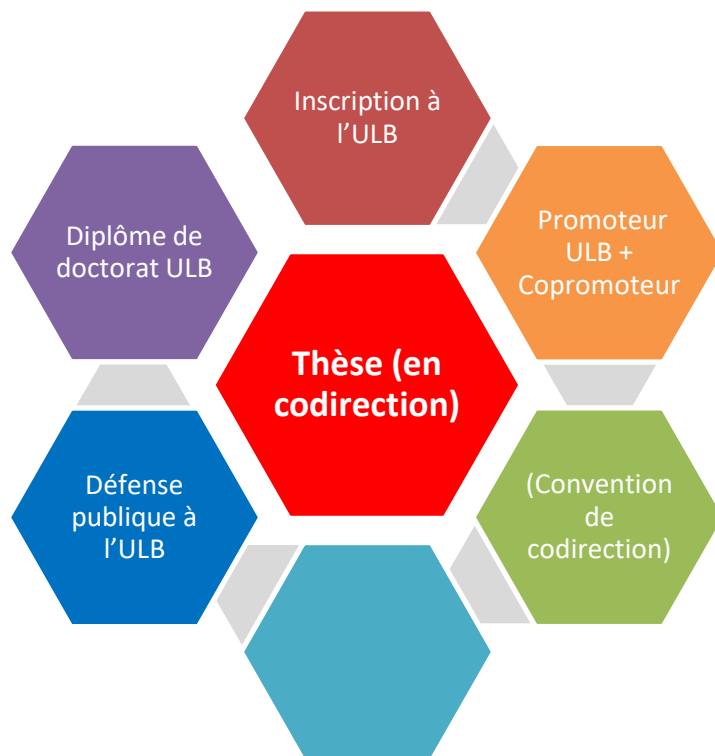
THESE (en CODIRECTION)