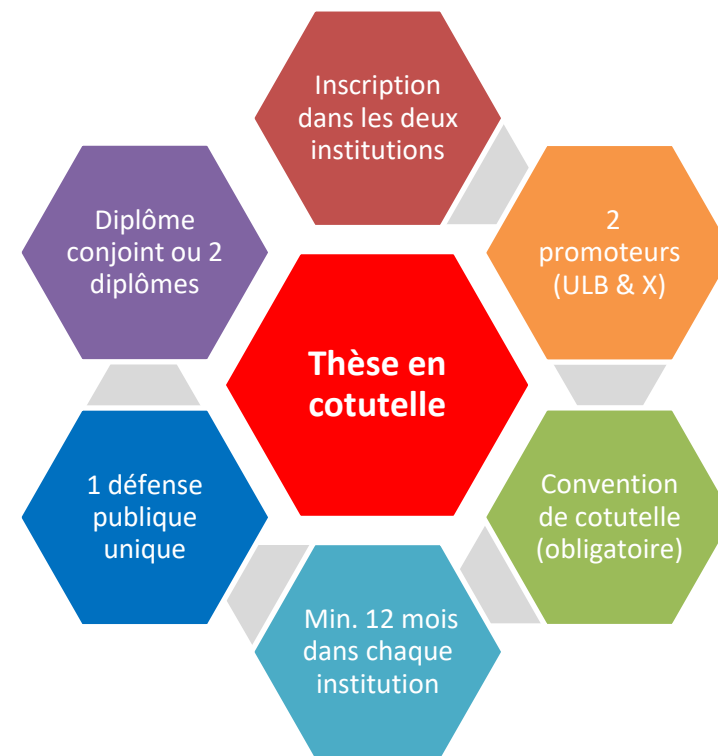
THESE en COTUTELLE