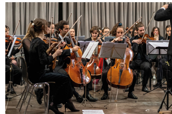
Orchestre de l'ULB